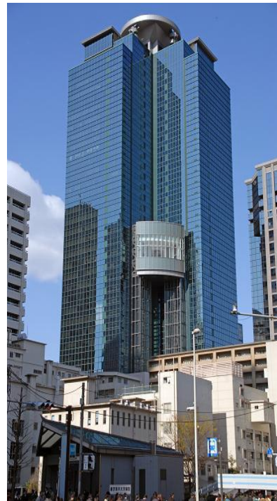
新宿オークタワー 地下2階・地上38階+2階 S造 述床 164,283 m 2