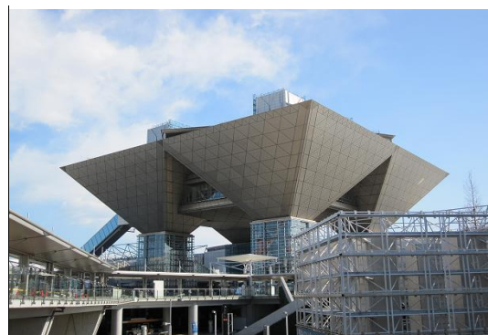
東京ビッグサイト