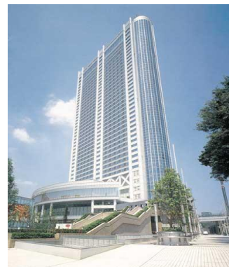
東京ドームホテル SRC 地下3階・地上43階