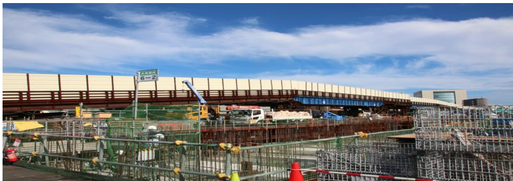
清水建設 株式会社 (土木) 東京外環道大和田工事