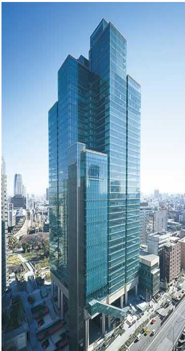
泉ガーデンタワー 地下4階・地上44階+2階 S造 述床 204,058 m 2