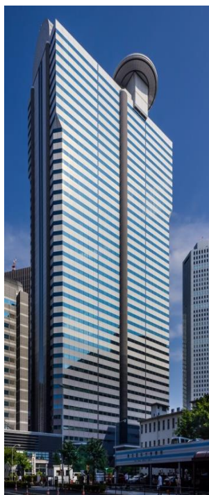
新宿アイランドタワー 地下4階・地上44階+2階 S造 述床 204,058 m 2