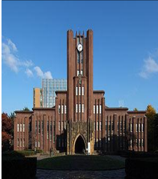
清水建設 株式会社 (改修・耐震補強) 東京大学安田講堂改修・耐震補強工事 地下1階・地上7階 SRC造 述床 6,990 m 2