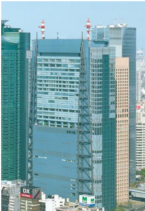
清水建設 株式会社 (改修) 日テレタワー 地下4階・地上32階+塔屋2階 SRC造 述床 130,000 m 2