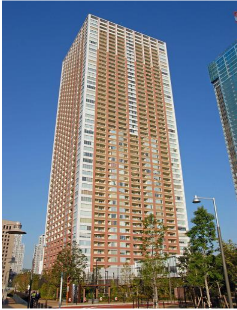
㈱シミズ・ビルライフケア 芝浦アイランド 地下1階・地上48階