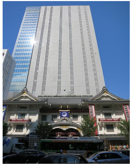
歌舞伎座タワー (改修) 地下4階・地上29階+塔屋2階 S造 94,097 m 2