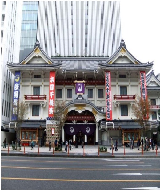
歌舞伎座演舞場 (改修) 地下1階・地上5階 (メガトラス鉄骨)