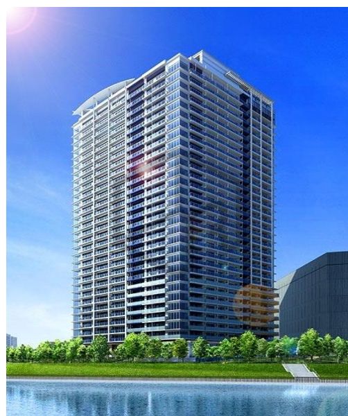
東京ワンダフルプロジェクト 《BAYZ》GARDEN 地下1階・地上31階+塔屋1階 RC造 述床 64,700 m 2