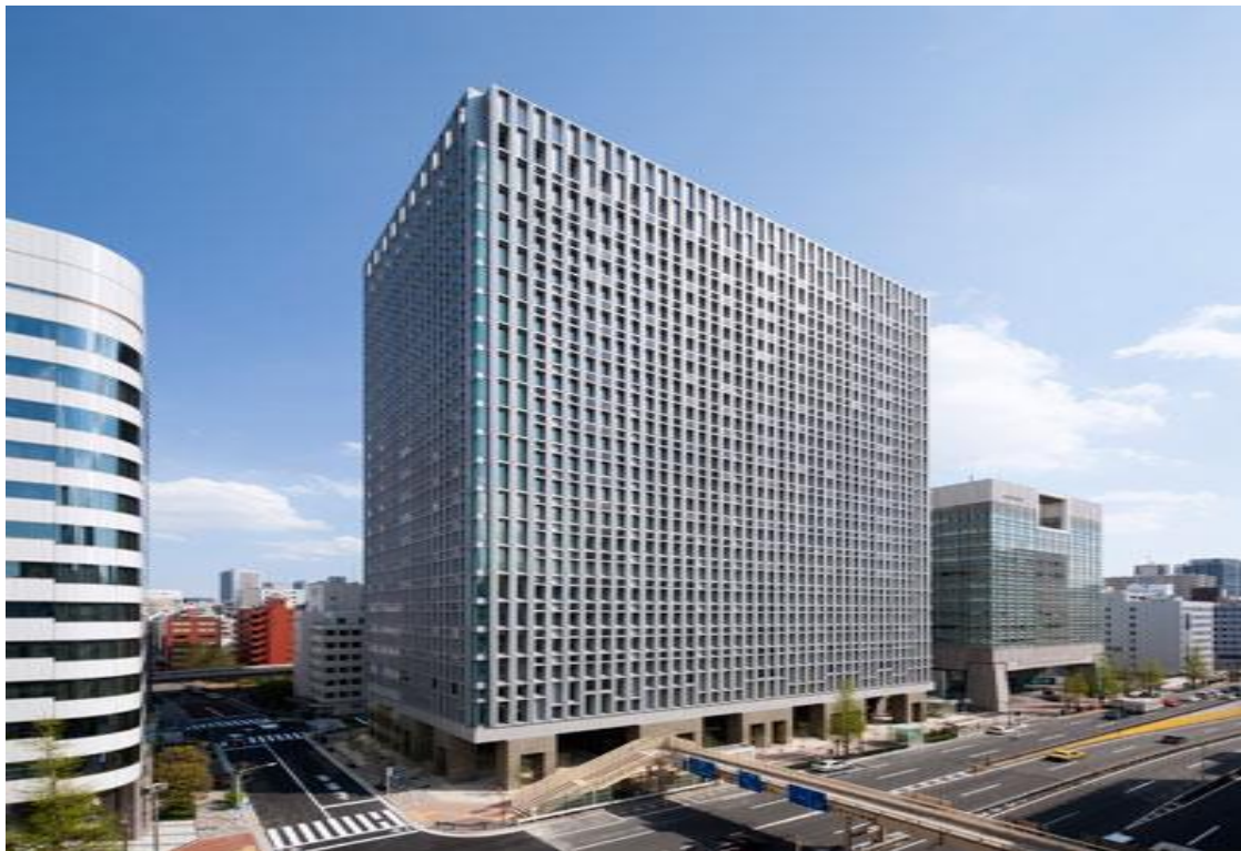
清水建設本社ビル 地下3階・地上22階+塔屋1階 RC造 51,365 m 2