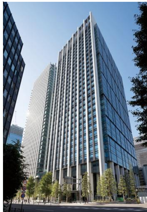
清水建設 株式会社 (改修) 大手町フィナンシャルシティノースタワー S・SRC 地下4階・地上31階 全体：述床 109,619 m 2