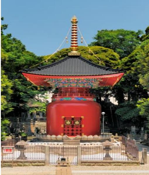
清水建設 株式会社 (改修) 池上本門寺 宝塔 (日蓮大使) 木造漆 地上1階 東京都重要文化財指定