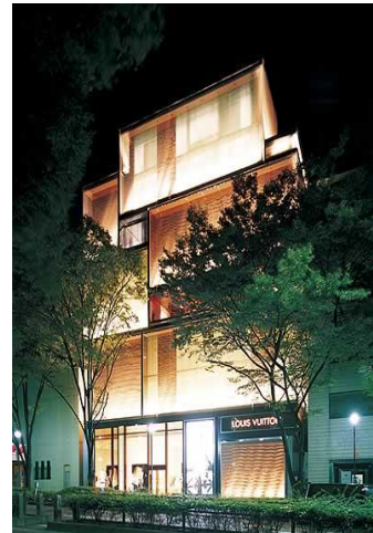
ルイヴィトン表参道