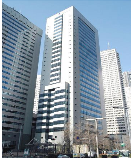
清水建設株式会社 工学院大学・エステック情報ビル 地下6階・地上26階 地下6階・地上25階