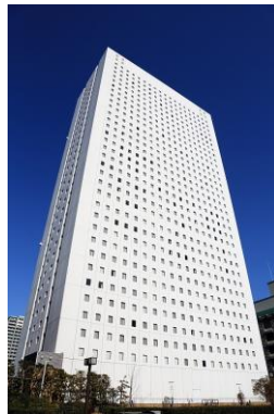
サンシャインプリンスホテル 地下4階・地上27階+2階