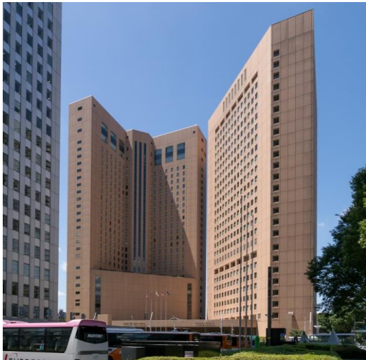
清水建設(株)・(株)竹中工務店 (改修) 小田急第一生命ビル 4/26+塔屋 2階 ハイアットリージェンシー東京 4/28階 ※各所J V工事として配置