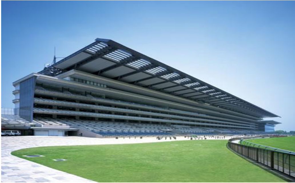
清水建設株式会社 東京競馬場スタンド改修