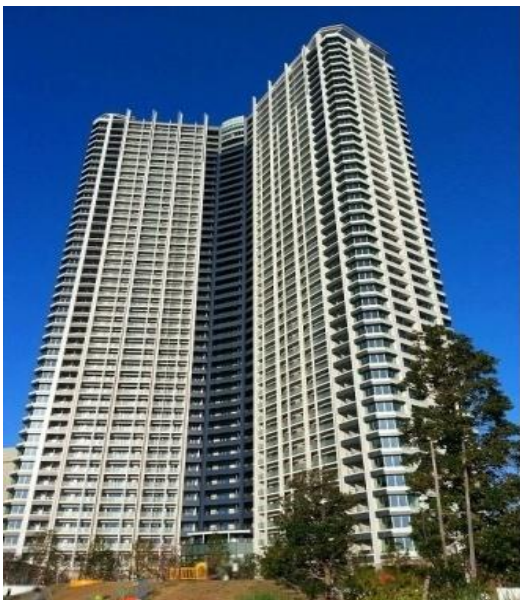
東京ワンダフルプロジェクト 《SKYZ》GARDEN 地下2階・地上44階+塔屋2階 SRC造 述床 141,500 m 2