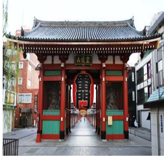
清水建設株式会社