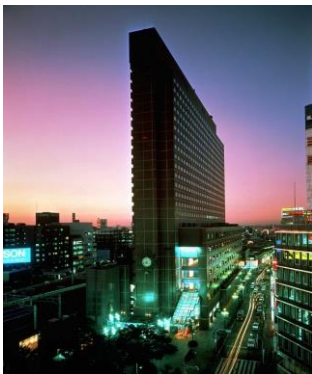
新宿プリンスホテル 地下4階・地上25階