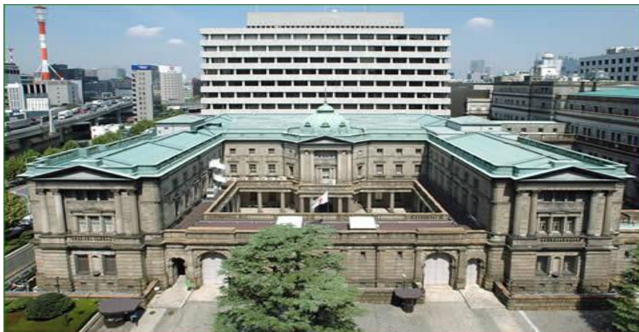
清水建設株式会社 明治 29 年 2 月竣工 重要文化財指定 免震化工事