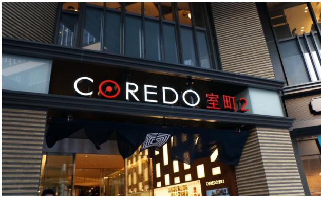
清水建設 株式会社 (土木) コレド室町連絡道・三洋販売ビル連絡道・日本橋駅地下道改修