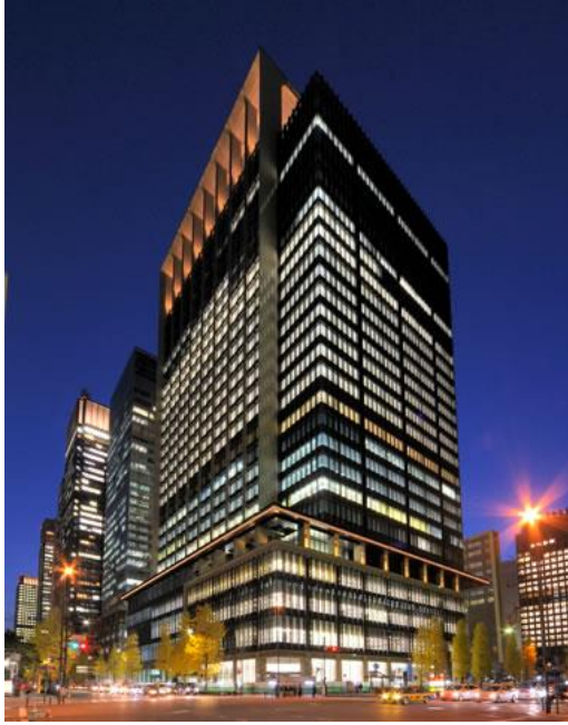
清水建設 株式会社 (改修) 丸の内永楽ビルディング 地下4階・地上27階 S・SRC 延床 139,684 m 2