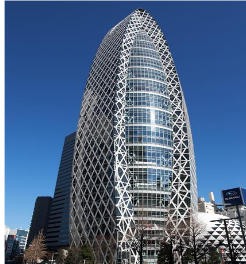
清水建設 株式会社 (改修) 東京モード学園コクーンタワー 地下3階・地上50階 S造 述床 80,865㎡