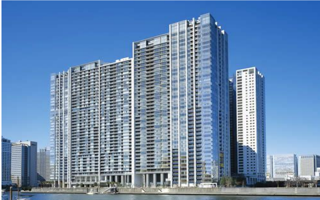
ワールドシティタワーズ S・SRC・RC 天王洲プロジェクト 延床 291,271 m 2 アクアタワー 地下2階・地上40階+塔屋1階 ブリーズタワー 地下2階・地上42階+塔屋1階 キャピタルタワー 地下2階・地上41階+塔屋1階