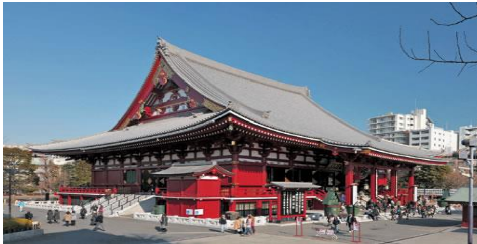
清水建設株式会社 浅草寺本堂