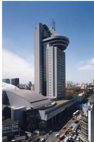
文京シビックセンター