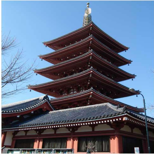
清水建設株式会社